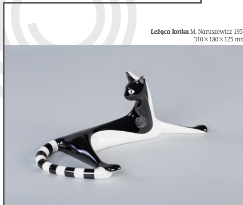
Leżąca kotka M. Naruszewicz 1958 310×180×125 mm