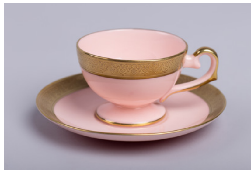
Filiżanka Prometeusz do espresso A. Spała 2008 różowa porcelana 90 ml