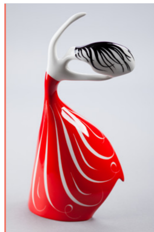
Dafne – zatańcz ze mną L. Tomaszewski 2011 290×130×60 mm