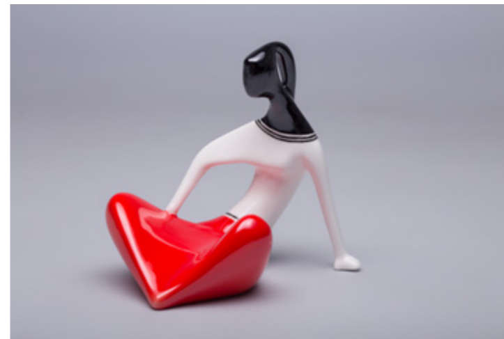
Dziewczyna siedząca H. Jędrasiak 1958 140×140×140 mm