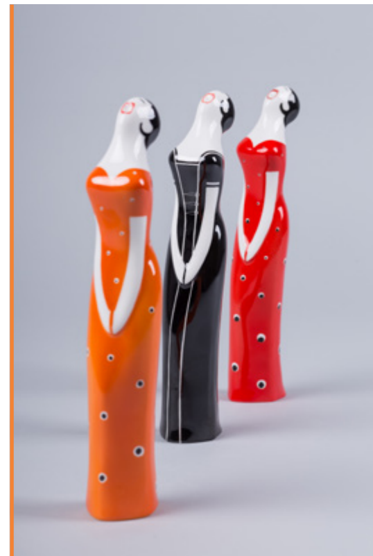
Śpiwaczka L. Tomaszewski 1959 230×55×50 mm