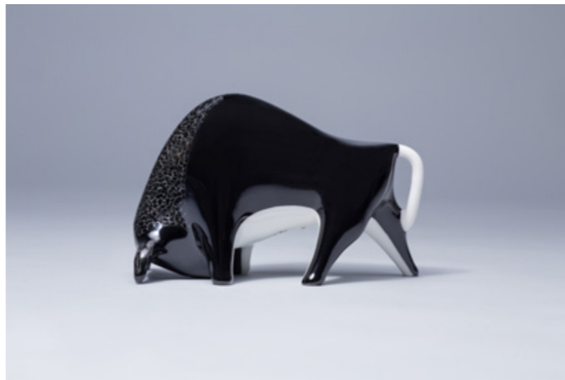
Zubr M. Naruszewicz 1957 180×115×85 mm