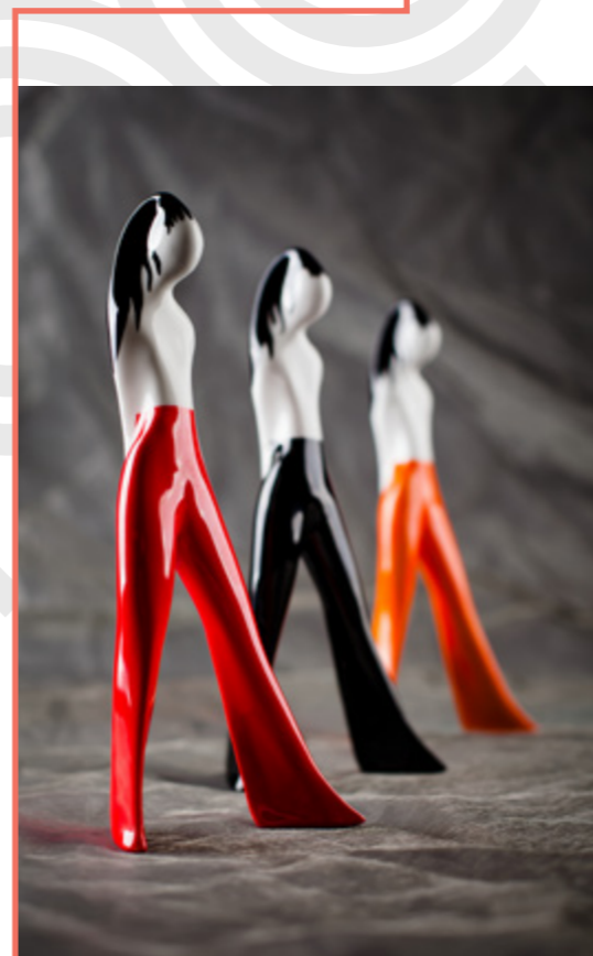
Dziewczyna w spodniach L. Tomaszewski 1961 245×90×70 mm