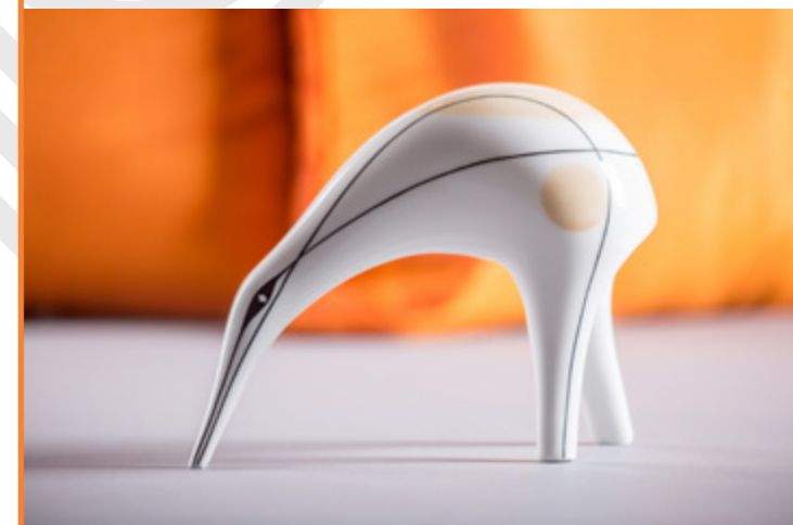
Kiwi L. Tomaszewski 1958 180×150×70 mm